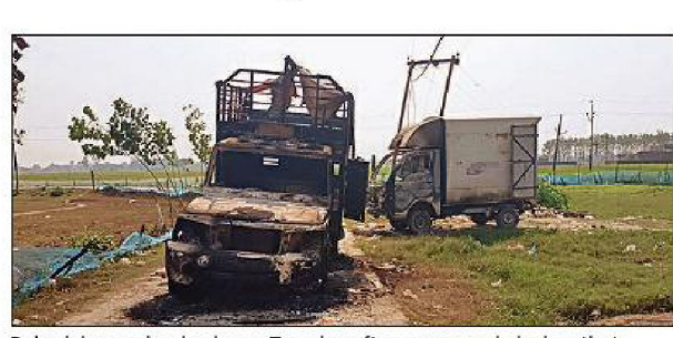
Bahraich remained calm on Tuesday after communal clashes that began during a Durga idol's immersion Sunday

gunshot wounds during Sunday's clashes that broke out when the Durga devotees were confronted by members of another community, demanding DJ music be stopped. Half-a-dozen others were injured in stone-pelting and firing. Violence had flared again Monday when Mishra's last rites were performed.